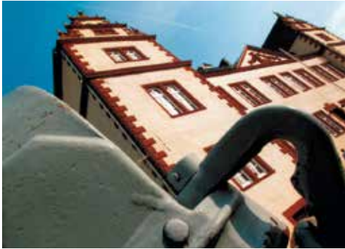
Das Schloss Salder in Salzgitter – attraktiver Ort für vielseitige Ausstellungen

Firma IKEA. Aber in den 31 Stadtteilen Salzgitters gibt es neben weiteren Großunternehmen wie MAN, der Salzgitter AG und zahlreichen mittelständischen Betrieben auch reizvolle Angebote für Erholungssuchende: zum Beispiel den staatlich anerkannten Luftkurort Salzgitter Bad mit einer der stärksten Thermalsolequellen Deutschlands. Unter www.salzgitter.de erfahren Sie im Internet mehr über diesen Standort.