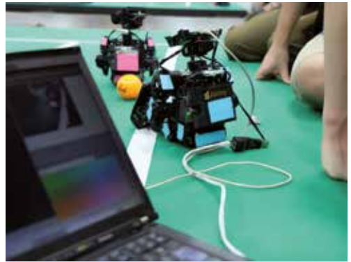
Die Humanoiden des RoboCup-Teams der Ostfalia

Beim Team wob-racing stehen die Konstruktion, Fertigung und Erprobung von Rennwagen im Mittelpunkt. Studierende mit einer Leidenschaft für Motorsport sind in diesem Team herzlich willkommen. Kontakt: info@wob-racing.de