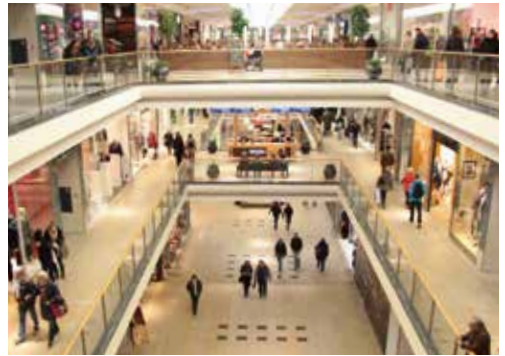
Modern Shoppen in Braunschweigs Innenstadt

In Braunschweig entwickelte sich die im Jahr 1905 gegründete Christlich-Soziale Frauenschule zur Höheren Fachschule für Sozialarbeit des Landes Niedersachsen. Dreiundzwanzig Jahre nach der Gründung dieser Einrichtung entstand das Technikum in Wolfenbüttel. Diese private Lehranstalt bot ein Studium sowie staatlich anerkannte Abschlussprüfungen in den Bereichen Maschinenbau und Elektrotechnik an. 1968 wurde aus dem Technikum eine Staatliche Ingenieurakademie bevor es 1971 den Status einer Fachhochschule erlangte. Mit dem Zusammenschluss mit der Höheren Fachschule in Braunschweig entstand so im selben Jahr die Fachhochschule bzw. die heutige Hochschule Braunschweig/Wolfenbüttel. Die Erfolge der Hochschule zeigen sich unter anderem an stetig wachsenden Studierendenzahlen sowie an der Gründung zahlreicher weiterer Fachbereiche: Von 1971 bis heute ist die Anzahl der Studierenden von 850 auf rund 13.000 angewachsen. Und mit ihren mittlerweile zwölf Fakultäten ist die Hochschule darüber hinaus inzwischen an vier