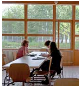
Sonnenterrasse in Salzgitter (oben) und Mensa in Suderburg