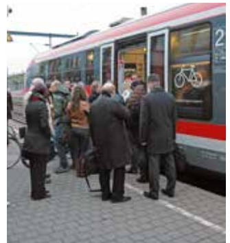
Mobil durch den Nahverkehr des VRB – die Standorte entspannt erreichen