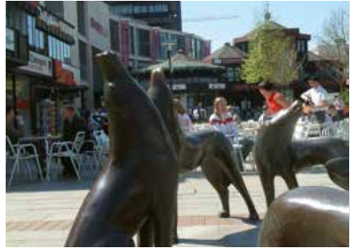
Die Wolfsburger Wölfe auf der Shoppingmeile

Fußball- und Fahrzeugbegeisterten ist dieser Hochschulstandort sicherlich auch durch den VfL Wolfsburg und die Autostadt ein Begriff. Weniger bekannt ist, dass die Einwohner u. a. aufgrund ihrer Sportbegeisterung zu den gesündesten in Norddeutschland gehören. Als Wirtschaftsstandort ist Wolfsburg in Niedersachsen die Nummer eins – und das bei vergleichsweise günstigen Mietkosten. Hohe Lebensqualität bescheinigt zudem eine Umfrage der Braunschweiger Zeitung, bei der mehr als zwei