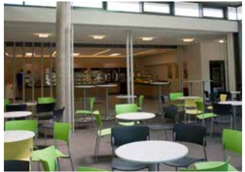
... und kalten Getränken

Warme Mahlzeiten, Getränke und Snacks bieten an allen Standorten der Hochschule Mensen und/oder Cafeterien.