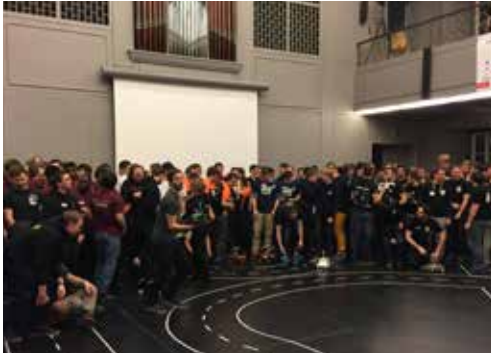
Auf der Rennstrecke erfolgreich: Die autonomem Fahrzeuge des OstfaliaCup-Teams.