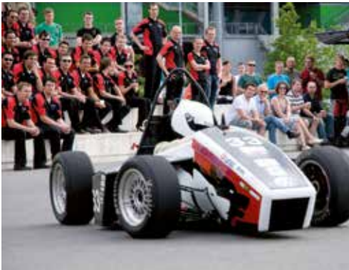
Rennwagen sind die Leidenschaft des Teams wob-racing