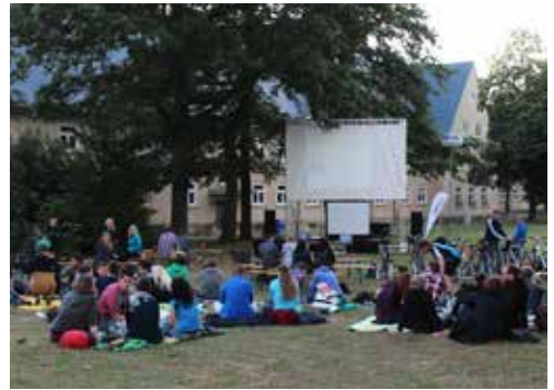
Fahrradkino - auch das macht der Filmclub der Ostfalia möglich.

Das Team e.wolf ist eine studentische interdisziplinäre Projektgruppe, die sich am Campus Wolfsburg seit 2012 intensiv mit autonom fahrenden Modellfahrzeugen beschäftigt. Ziel ist es, ein selbst konstruiertes Modellauto im Maßstab 1:10 so aufzubauen, dass es autonom einen Parcours mit Hindernissen bewältigen kann, die ebenfalls dynamisch sein können. Kontakt: eWolf@ostfalia.de