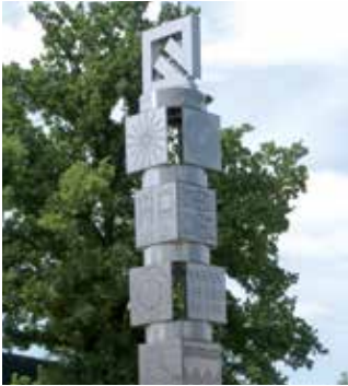
Der „Turm der Technik“ am Campus Wolfenbüttel