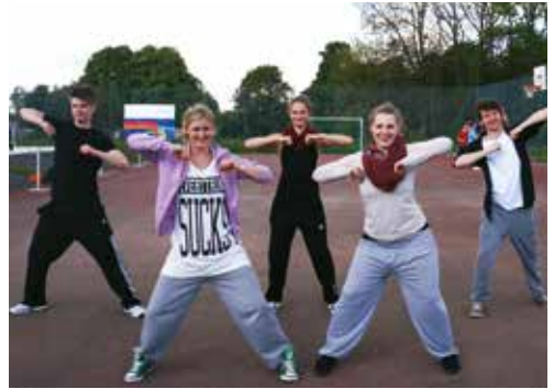
Gemeinsam Trainieren mit dem Hochschulsport