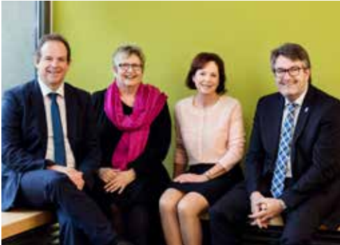
Das Präsidium der Ostfalia