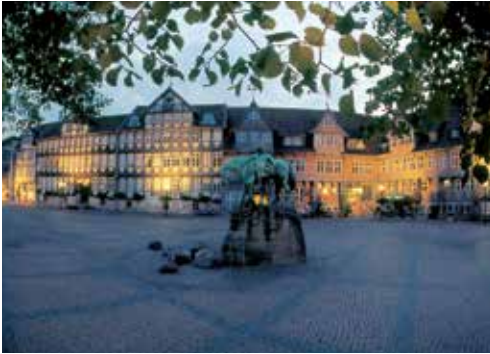
Aufwendige Fachwerk- und Backsteinfassaden – das Wolfenbüttler Rathaus am Abend

zahlreichen Cafés und Geschäften ist ein Anziehungspunkt, auch die Open-Air-Veranstaltungen des „KulturSommers“ im Schloss Wolfenbüttel und der nahegelegene Naturbadensee Fämmelsee mit über 13.000 Quadratmetern Wasserfläche sorgen für Lebensqualität und Freizeitvergnügen in Wolfenbüttel. Mehr Informationen finden Sie unter www.wolfenbuettel.de .