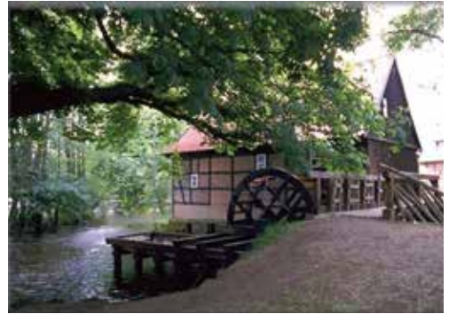
Suderburg – ein idyllischer Ort für Naturliebhaber

Da das Studierendenwohnheim direkt auf dem Campus liegt, finden sich hier ideale Bedin-