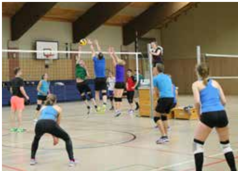
Gute Stimmung und voller Einsatz beim Turnier während der Ostfalia Volleyball-N8 in Salzgitter

Aber auch die Standorte der Hochschule haben ihren besonderen Reiz. Sie verbinden die Nähe zu namhaften Unternehmen und Forschungseinrichtungen mit einem breitgefächerten Kulturangebot sowie vielfältigen Ausflugsmöglichkeiten. Welche Lokalitäten vor Ort für einen unterhaltsamen Abend in Frage kommen, zeigt Ihnen übrigens das Erstsemesterprojekt bei einer kleinen Kneipentour.