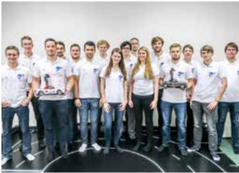
Ein Team für ein (Modell)Auto