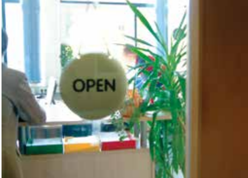
Geöffnet für die Anliegen der Studierenden