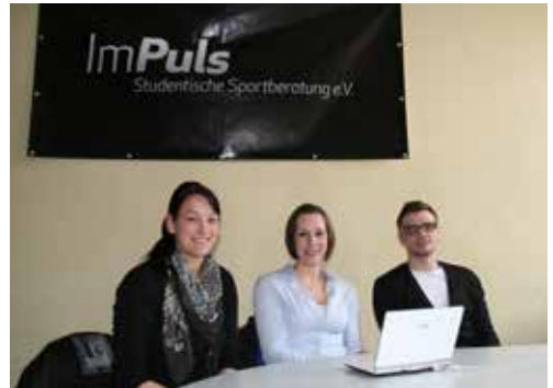
ImPuls – Studentische Sportberatung e.V.