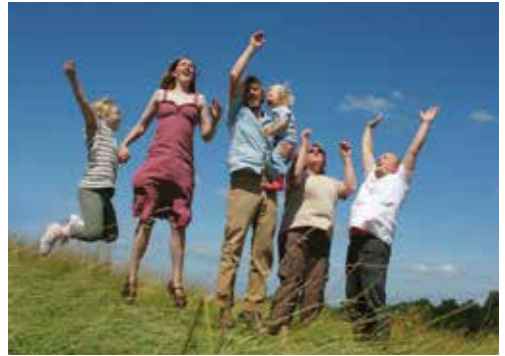
Die Ostfalia fördert eine familienfreundliche Hochschulkultur

An den meisten Ostfalia-Standorten gibt es hochschulnahe Kinderbetreuungsangebote ab dem Krippenalter, in Wolfenbüttel zusätzlich eine flexible Betreuung. Eine Übersicht sowie regionale (Vermittlungs-)Stellen für Tagespflege, Babysitter, Notfallbetreuung oder Ferienbetreuungsangebote finden Sie auf den o. g. Internetseiten.