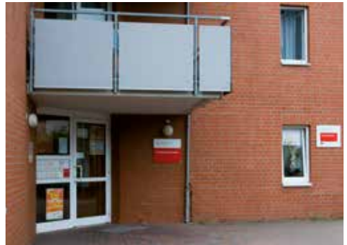
Die Wohnheime des Studentenwerks