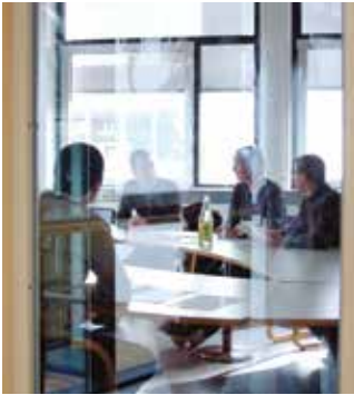
Raum für Diskussionen – Studierende können das Hochschulleben aktiv mitgestalten

Die studentische Selbstverwaltung – eine rechtsfähige Teilkörperschaft unserer Hochschule – setzt sich aus folgenden Einrichtungen zusammen: